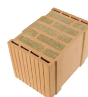
ThermoCellit® MZ80-GS mit erhöhter Druckfestigkeit